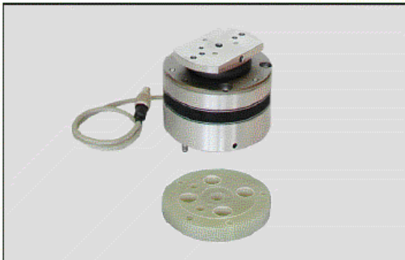
Desconector de seguridad con pletina de adaptación