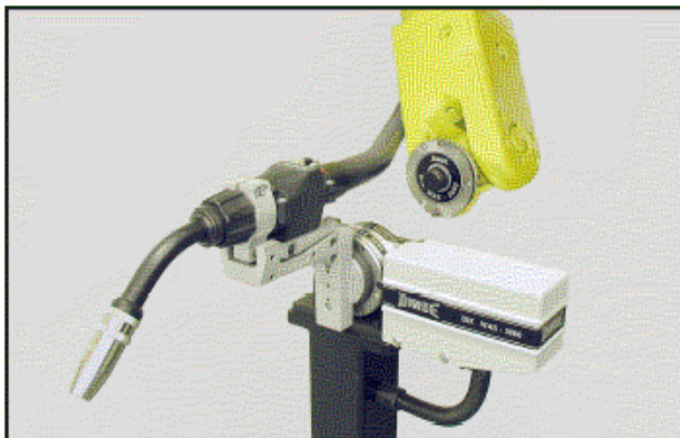
Antorcha en estación de depósito sin amarrar en robot