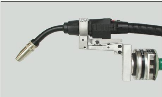
Sistema de antorcha con porta herramientas y mandril de acoplamiento montado en robot