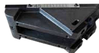
Art. Nr. 1965