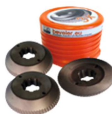
Art. Nr. 1972