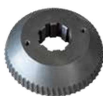
Art. Nr. 1971