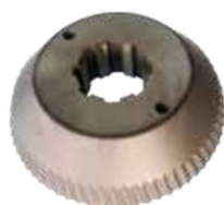
Art. Nr. 1970